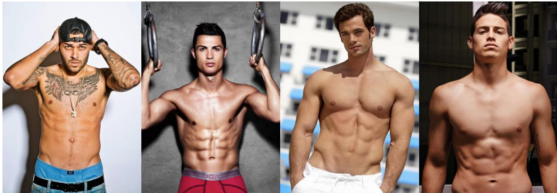
Ideal de cuerpo masculino perfecto que tienen los entrevistados.

“Si nos vamos de lado de la mercadotecnia sí hay un ideal de cuerpo masculino ideal. Que es tener buena estatura, musculoso y que tenga lujos, se me viene a la mente James Rodríguez” (Estudiante UNAM)