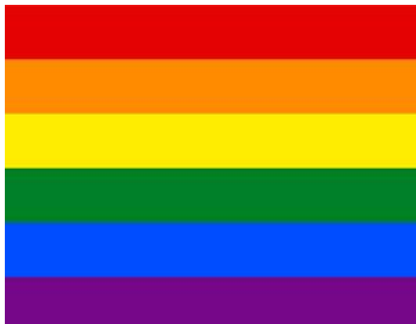
Bandera actual del orgullo gay (Rojo, Naranja, Amarillo, Verde, Azul, Violeta)

En 1979 la bandera fue modificada y se formó el diseño actual de seis franjas. Hoy en día la población LGBTI y defensores de los derechos de esta población, utilizan la bandera en las puertas de sus casas o utilizan calcomanías de arco iris en sus vehículos como un símbolo de su apoyo a la homosexualidad.