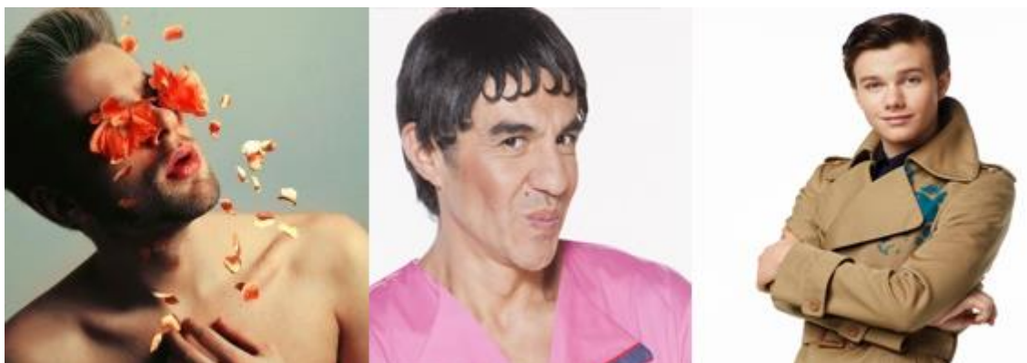
Principales estereotipos mencionados por parte de los entrevistados.

marica, el amanerado, el que se viste de mujer, la jotita, la jotita de zona rosa y hasta hay clases sociales, el joto súper naco y el joto súper rico y que se viste súper bonito ". (Estudiante IBERO)