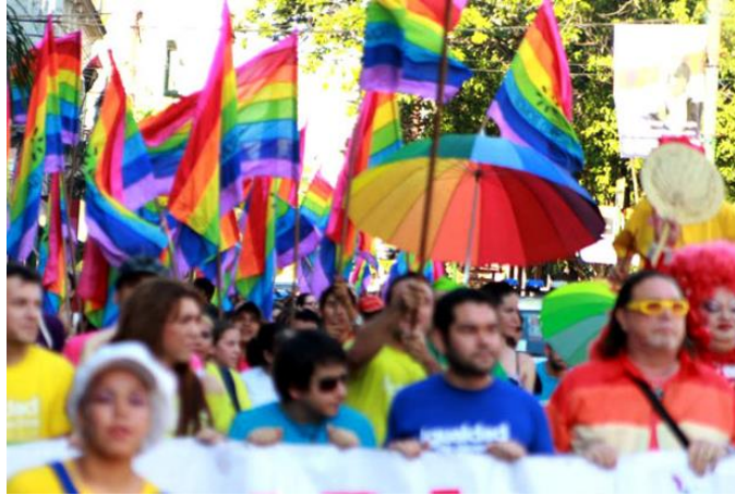
Fotografía de la marcha gay en la Ciudad de México

1979 Primera Marcha del Orgullo Homosexual en la ciudad de México. José Joaquín Blanco publica Ojos que da pánico soñar , que muchos activistas adoptan como manifiesto homosexual.