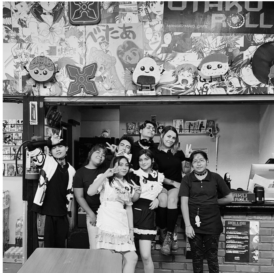
Foto extraída de la página de Facebook de Otaku Roll.