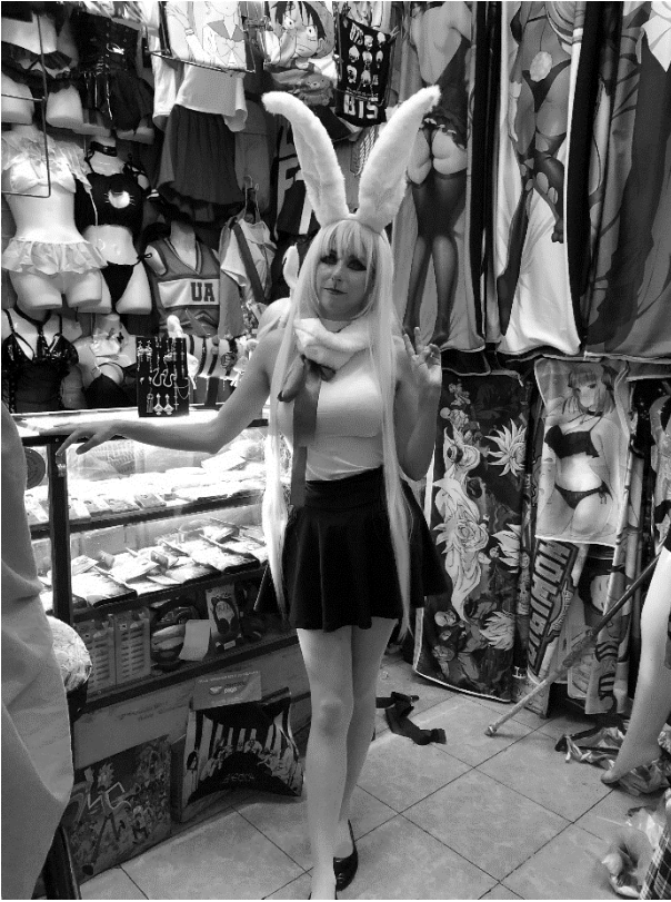
Ilustración 2. Cosplay de conejita.