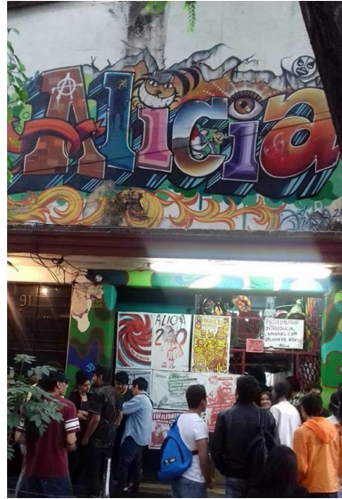
Fachada y entrada del Multiforo Alicia.

La tocada fue el festejo en conmemoración del tercer aniversario de Venganza TV un medio de comunicación digital que apoya y difunde proyectos de música independiente, por lo que diferentes bandas que son parte de este medio serán las encargadas de presentarse.