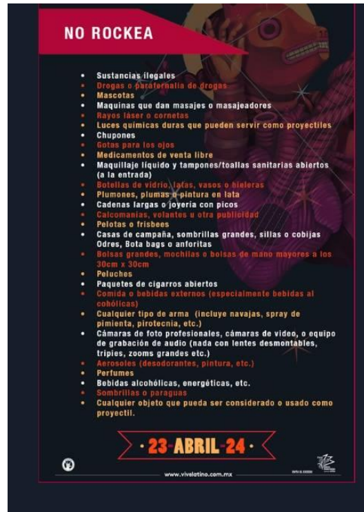
Imágenes tomadas de la app del Vive Latino. Vive Latino 2016.