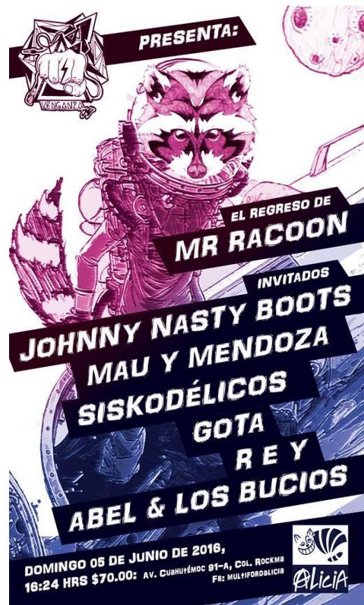
Cartel Multiforo Alicia

El Foro Sol y Multiforo Alicia son espacios totalmente distintos, el primero y más notorio es la dimensión, el primero es un autódromo que dividen en diversas partes y el segundo es una gran bodega con grafitis en las paredes, los escenarios con diferentes tamaños, los del festival patrocinado por la cerveza tiene una gran producción, escenarios altos en los que las bandas parecen inalcanzables en tanto el Alicia con un escenario casi a nivel del piso donde es posible compartir más que la música.