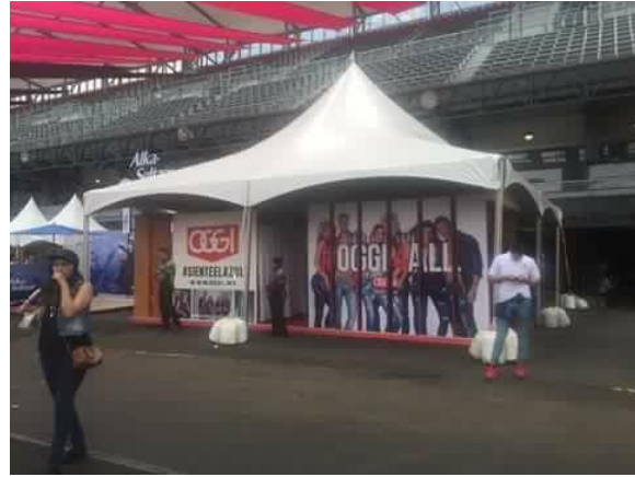
Vive Latino 2016.

Son una gran cantidad de jóvenes los que se desplazan por el recién remodelado Foro Sol, vestidos de jeans o shorts pues el clima caluroso se siente en el asfalto del autódromo, con tenis, playeras, camisas a cuadros son las prendas básicas para este concierto, pareciera que muchos se pusieron de acuerdo para vestir de tal o cual manera pues todo es muy similar.