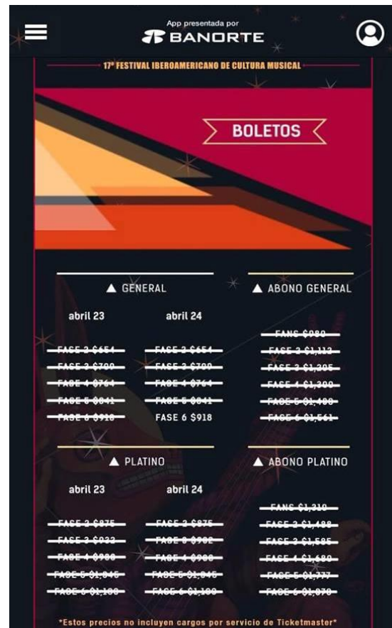
Imágenes tomadas de la app del Vive Latino. Vive Latino 2016.

Los jóvenes se preparan pensando en qué llevarán, qué usarán, pero el mismo festival es el que pone las reglas de lo que entra y lo que no, para ello hace una lista con especificaciones.