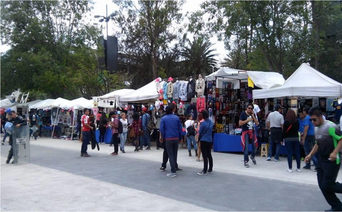
Los puestos de souvenirs a las afueras del Foro Sol. Vive Latino 2016.

Por otra parte muchos jóvenes se acercan a la entrada en donde muestran su boleto y son revisados de pies a cabeza, a las chicas con bolsa les hacen sacar cada uno de los artículos para ver qué son, en tanto sobre una de las mesas se puede ver una lista con los objetos que pueden y lo que no son permitidos pasar al concierto.