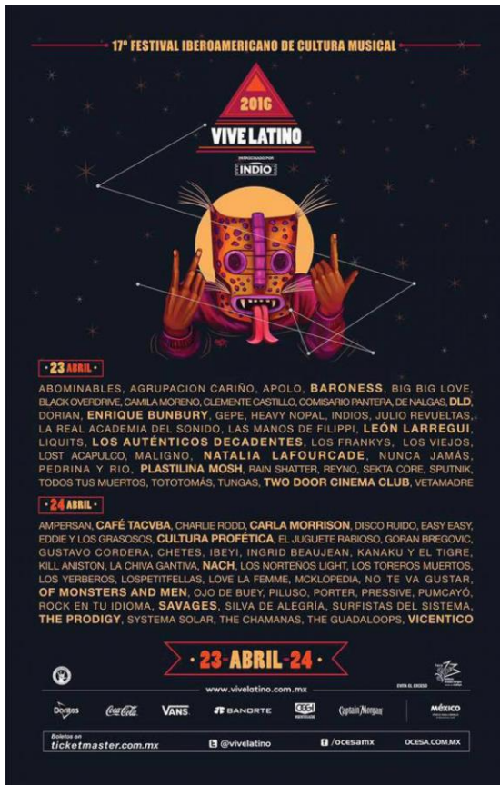
Cartel Vive Latino 2016