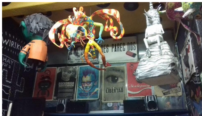
Multiforo Alicia.

Después de una hora formados en la fila para poder acceder al lugar, por fin los jóvenes comienzan a avanzar, el pasillo está adornado con carteles de diversos conciertos del Foro Alicia, el precio de admisión de ese día es de 70 pesos, los precios varían dependiendo de la tocada, pero en general el costo es accesible; una vez adentro cada joven comienza a sacar el dinero para pagar por su entrada, les entregan su boleto de acceso y enseguida se los piden para colocarles un sello en el antebrazo con la imagen de Disney de la famosa película Alicia en el país de las maravillas.